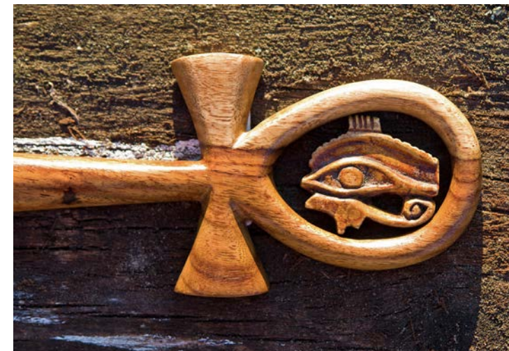
Nilský kříž s Hórovým okem, symbolem egyptské školy mysterií.

Podávám mu ruku. „Děkuji za zajímavé setkání a inspirativní myšlenku. A... omlouvám se, nepostřehl jsem vaše jméno.“