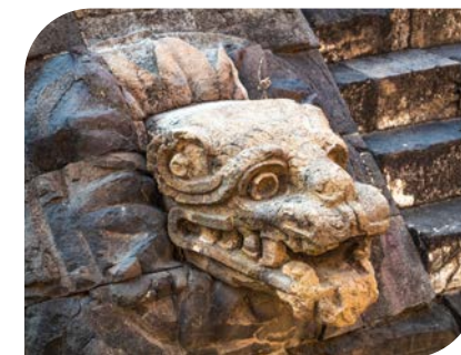
Démon chrlící oheň ze stěny jedné z pyramid v Teotihuacánu.

Jedním z božstev byl bůh deště Chak, známý již z raného Teotihuacánu, což je jeden z nejznámějších světových pyramidových komplexů. Jakožto významná síla poskytující životodárnou vláhu je bůh deště středem kosmografické struktury. Pátým rozměrem je tedy střed – hlavní osa či bod, v němž byla v okamžiku stvoření nebesa vyzdvížena z praoceánu. Hlavní osou se stal Strom stvoření s kořeny v Podsvětí a korunou sahající až do nebes. Barva středu byla modrozelená, což je posvátný odstín objevující se ve vodě, nebi, jadeitu