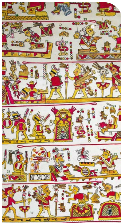
Kresby postav středověkých kultur připomínají egyptské „manuály“ mystickým putováním na Nebesích.

Právě v centrální Pyramidě Slunce se setkáváme se strukturou čtvernosti, která se dá připodobnit ke čtyřlístku, tedy symbolu štěstí. V podzemí uvnitř pyramidy archeologové objevili čtyři komory, každou na jedné ze čtyř světových stran. Podle legend se právě v těchto čtyřech komorách odehrávaly hlavní magické rituály. Jejich přesná podoba, smysl a účel jsou obestřené závojem tajemství, avšak ze struktury je možné odvodit, že hlavním cílem bylo především vyvažování a harmonizace mezi těmito čtyřmi prvky a následný spirituální vzestup.