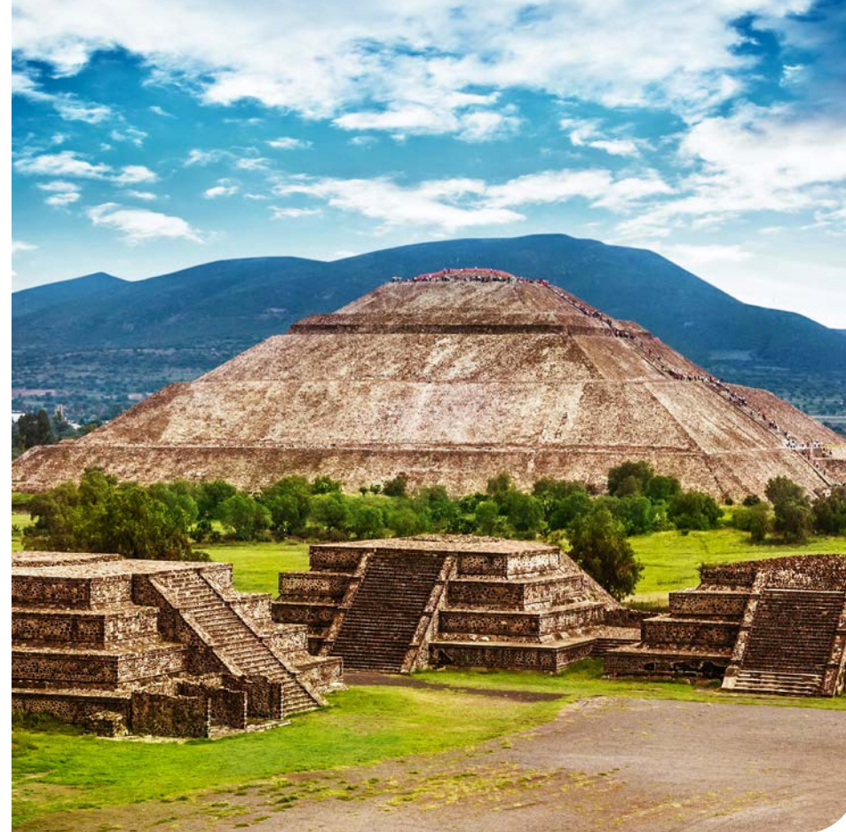
Stavební komplex v Teotihuacánu tvoří trojice hlavních staveb, podobně jako v egyptské Gíze.

lancování jedné poloviny, čtveřice „jin“ ženských prvků, a druhé poloviny, druhé čtveřice mužských „jang“ prvků. Právě rovnováha protikladných prvků jin a jang podporuje pozitivní a zdravý rozvoj společnosti.